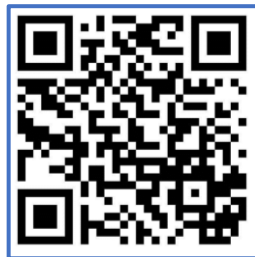
Facebook เพจ สำนักงานสาธารณสุขอำเภอบ้านฉาง