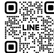
Line official สำนักงานสาธารณสุขอำเภอบ้านฉาง